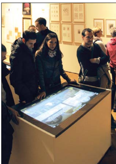
Una stazione multimediale L3