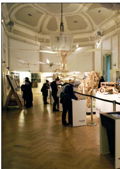
Una vista dell'allestimento della sala principale

http://www.leonardo3.net/MuseumLeonardo3