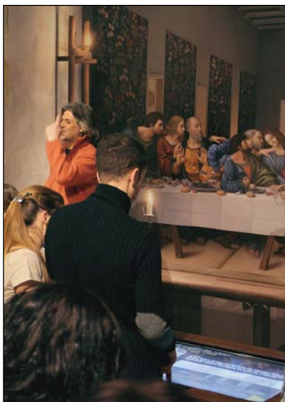
Il restauro digitale dell'Ultima Cena

l'Ultima Cena. Al Cavallo gigante, ovvero Il Monumento a Francesco Sforza , è dedicata una stazione che svela anche come avrebbe potuto essere il monumento completo. Le esperienze interattive sono tutte anche in lingua inglese, per favorire la fruibilità dei contenuti anche al pubblico internazionale (le audio-guide oltre che in italiano sono anche in inglese, spagnolo, russo, tedesco, francese e cinese). I visitatori possono sfogliare e comprendere facilmente e in maniera affascinante i contenuti dei fogli di Leonardo, utilizzare le sue invenzioni come mai prima, vivendo esperienze interattive, alcune destinate espressamente ai più piccoli, come Il Laboratorio di Leonardo , che consente di assemblare macchine leonardiane e stampare il proprio certificato di inventore, e il Ponte Autoportante da costruire fisicamente. Per quel che riguarda l'arte, l'importante restauro digitale dell' Ultima Cena consente per la prima volta dai tempi di Leonardo di scoprire i particolari e i colori ormai perduti per sempre del celebre dipinto murale.