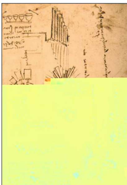
Il foglio 136r del Codice Arundel contenente il disegno originale di Leonardo del Can(n)one Musicale