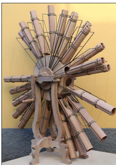
Il modello fisico del Can(n)one Musicale, presentato in anteprima mondiale il 26 febbraio 2014 a Milano